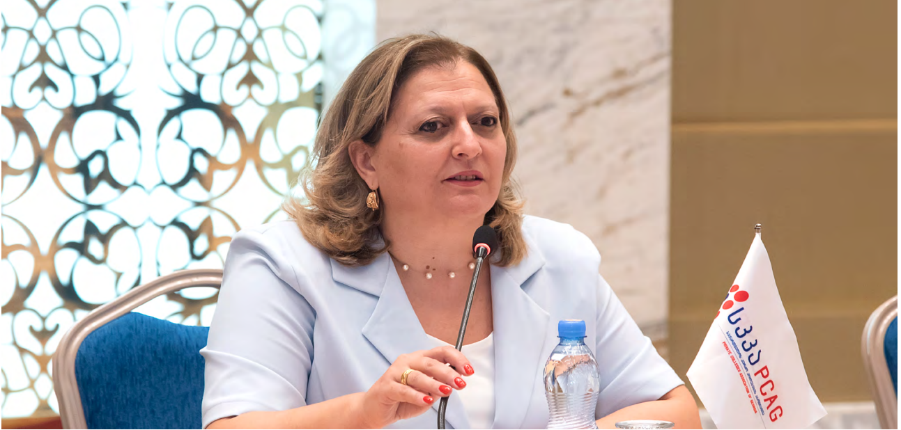
ია მრბამ.

თვითდასაქმების შესაძლებლობა. ახალგაზრდები ამ ინფორმაციას იღებენ ინტერნეტიდან ან სანაცნობო წრიდან, მათგან, ვინც მიიღეს გამოცდილება პროფესიულ განათლებაში და ამით წარმატებას მიაღწიეს. ამიტომ განსაკუთრებით მნიშვნელოვანია სწორ ინფორმაციაზე ხელმისაწვდომობა და კმაყოფილი და წარმატებული კურსდამთავრებულები. მაგალითად, თქვენი ურუნალი შესაძლებელს ხდის სანდო ინფორმაციის მიწოდებას დაინტერესებული მხარეებისთვის.