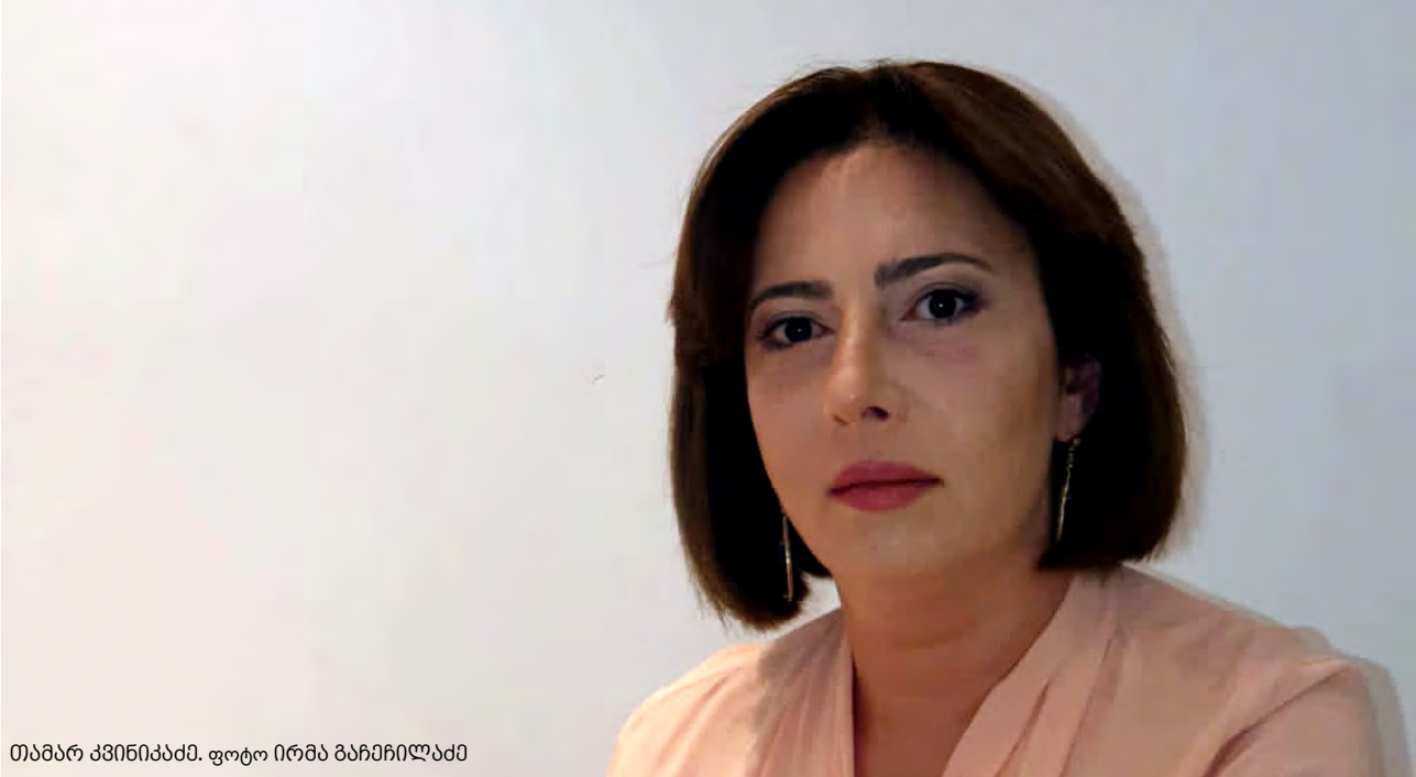
თამარ კვინიკაძე.