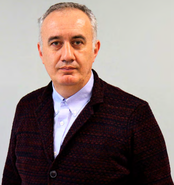
კავლე თვალთვლილი.

ქვეყანაში გვაქვს ასეთი პრობლემა – პროფესიის შექმნა არ არის პრეტისული საგანმანათლებლო პროცესი, მისი შედეგი კი მოთხოვნადია. მაგალითად, თუ რემონტის რომელიმე ჯგუფში შეხვალთ, ნახავთ, როგორ ფასობს იქ პროფესიის, ხელობის მცოდნე ადამიანი, ხშირად ის მართლაც სანთლით საძებარია.